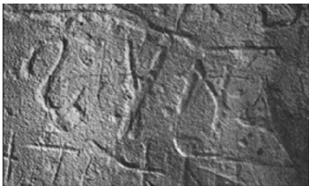
Табл. XV a Добруджански надпис. Естампаж Детайл.